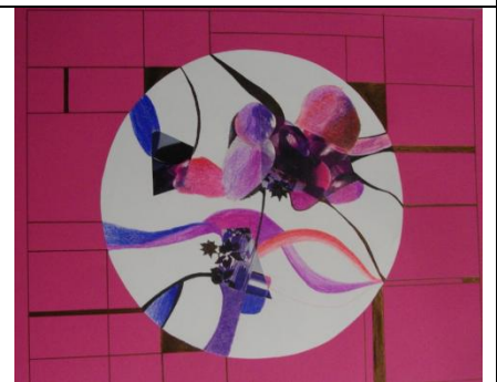
Ulvi Eit 9. klass