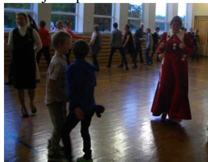
Jõulumooriga tantsu löömas