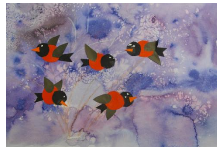
Meribel Pukk 2. klass