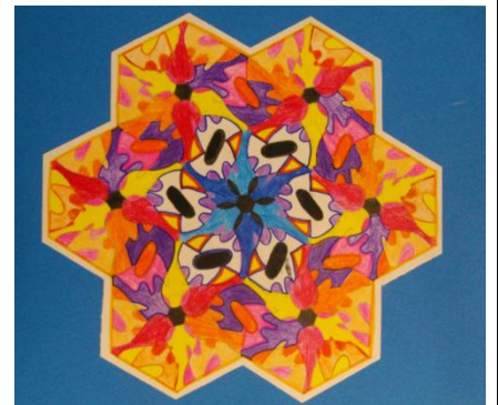
Nele-Liis Väise 8. klass