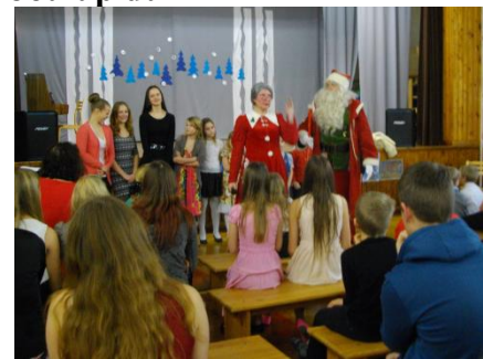
Jõulutaat koos mooriga