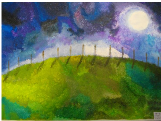
Severiin-Silvia Sumberg 7. klass