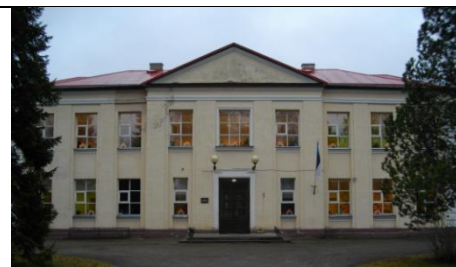
Koolimaja detsember 2015