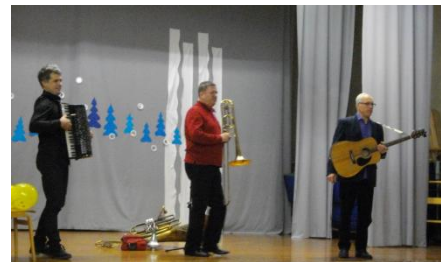
Sünnipäeva kontsert, esinemas „Trio Naturale”