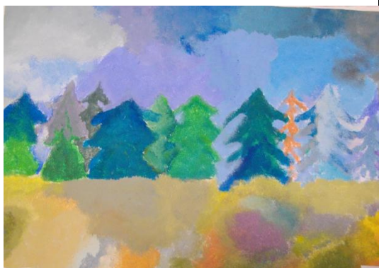
Brigitta Paal 7. klass