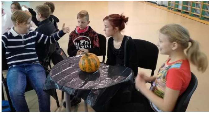
Meie kooli võistkond Kanepi Gõmnaasiumis